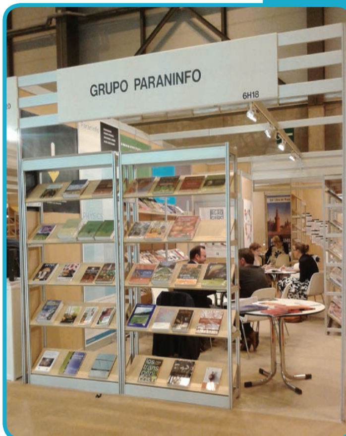
Grupo Paraninfo en la Feria de LIBER.

El Grupo Paraninfo nace en octubre de 2008 cuando Ediciones Nobel, propiedad de la familia García Cervero, compró el 100% de Ediciones Paraninfo, dos sellos muy diferentes, pero con un nexo común, la profesionalidad y la excelencia. En esta adquisición, se incorporó además el sello editorial Alfa Centauro. Dos años después, se unió Mundi-Prensa, ampliando así la oferta formativa técnica y de divulgación, con el mismo espíritu de satisfacer las demandas de alumnos, profesores, profesionales y aficionados.